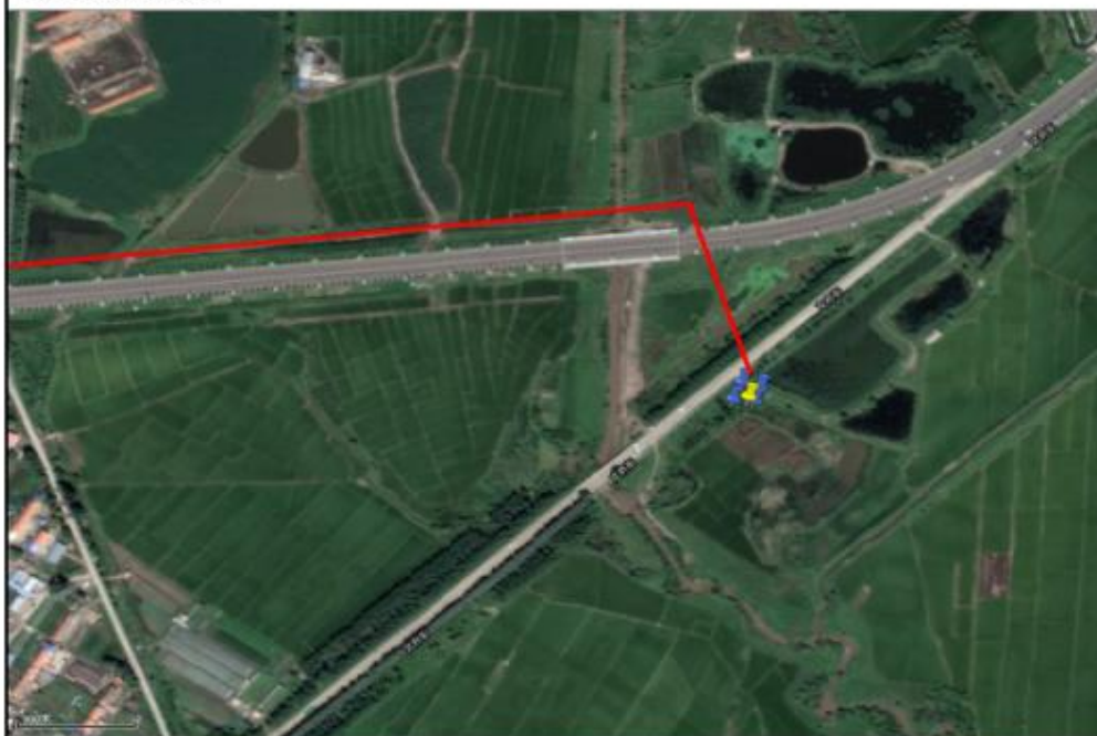
声环境监测点位示意图