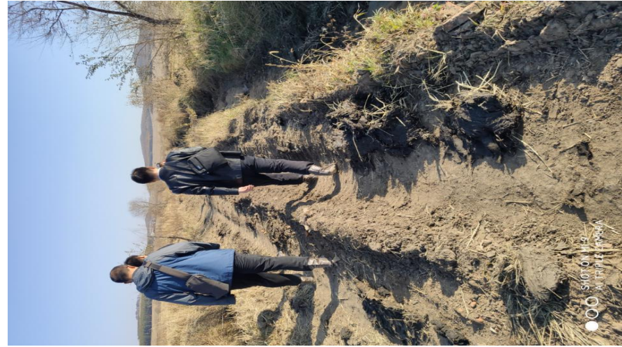
附图 2 本项目现场照片